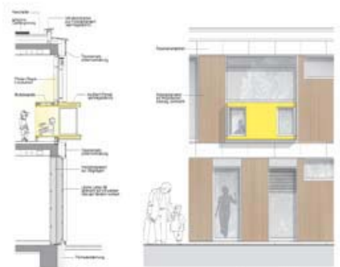
Fassadenschnitt / Ansicht 1:50