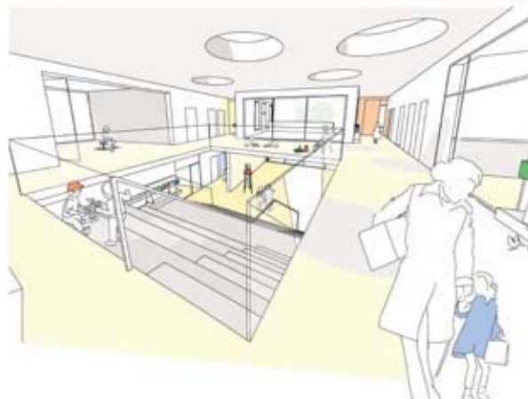
Innenraumperspektive - Blick in den Spielflur