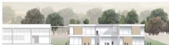
Ansicht Nord 1:200