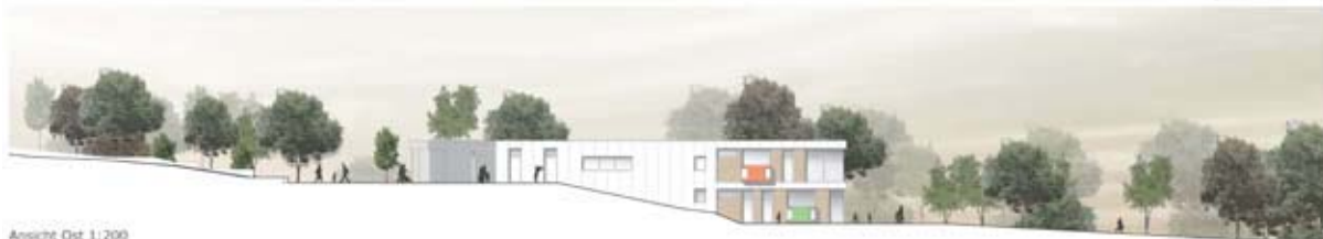
Ansicht Ost 1:200