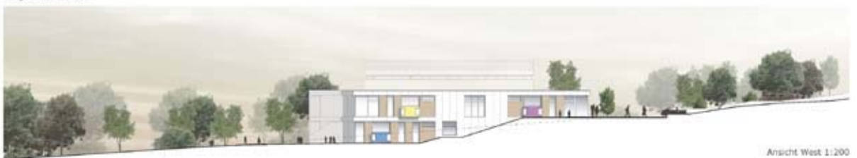
Ansicht West 1:200