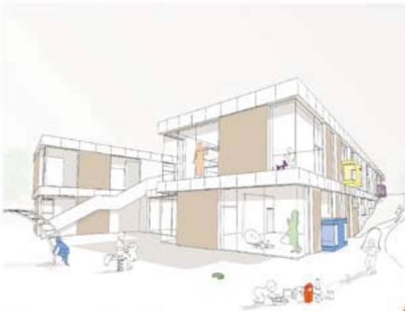
Außenraumperspektive - Blick vom Garten