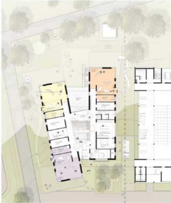
Erdgeschoss gerendet 1:200