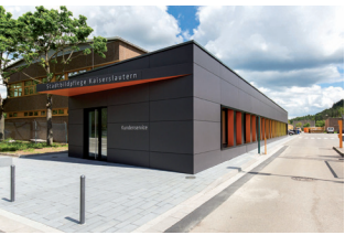
Guerrero Sahn, Kaiserslautern

Herxheim bei Landau/Pfalz, Urnengemeinschaftsanlage (2017) , Friedhof Herxheim, Kesslerstraße | Bauherrin Ortsgemeinde Herxheim | Landschaftsarchitekten ARGE Bettina Krell GmbH/Kurt Garrecht, Landschaftsarchitektin Bettina Krell, Oberrotterbach, Landschaftsarchitekt Kurt Garrecht, Herxheim | Mitarbeiterin Dipl.-Ing. (FH) Anke Rau-Dresselhaus, Klingenmünster | Termine Sa 14 - 18 Uhr, So 11 - 18 Uhr