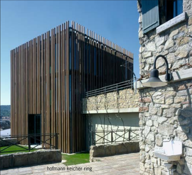
hofmann keicher ring