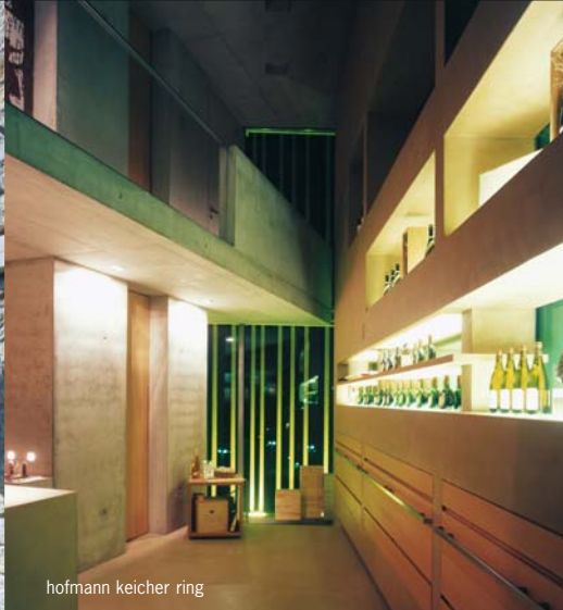
hofmann keicher ring